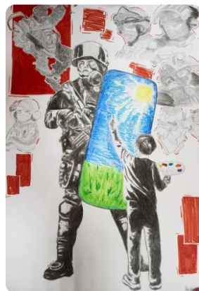
МИР ПРОТИВ ТЕРРОРИЗМА